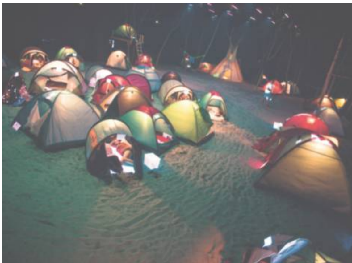
Mørket har sænket sig over lejren med 35 festivaltelt, hvor både de medvirkende og publikum indkvarteres under forestillingen.