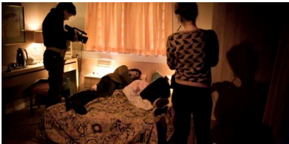
Teaterstykket 'Pretty Woman A/S' filmes og vises undervejs i forestillingen.