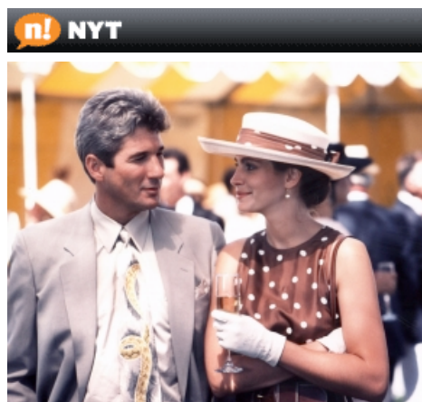
Har prostituerede en fremtid?

- Det er usælt, respektløst og langt ude. En styg form for social pornografi. De tager socialt udsatte kvinder ind og udstiller